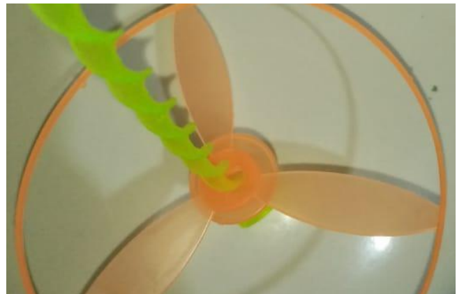
Figura 3: Montaje (vista vertical)